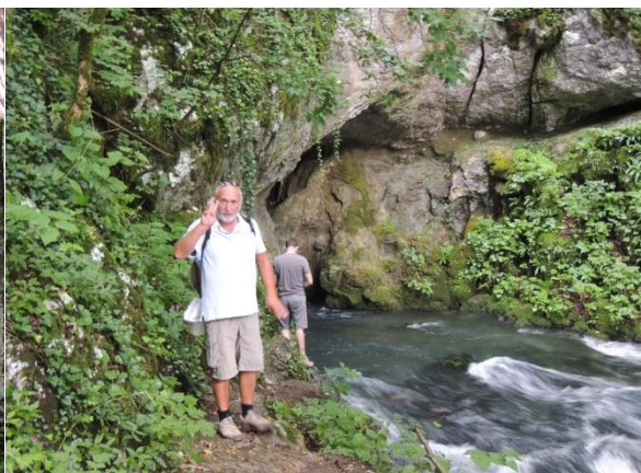
« Pliva River en crue »

Suite à de fortes précipitations les rivières Bosniaques étaient en crue... Nous avons effectué de la prospection et recensé de nombreuses résurgences et cavités karstiques.