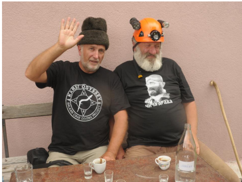
On y retournera en 2015 !!!!