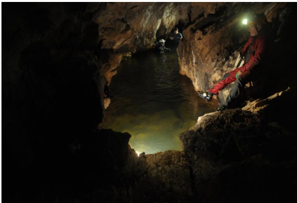
« Expédition fond de trou »