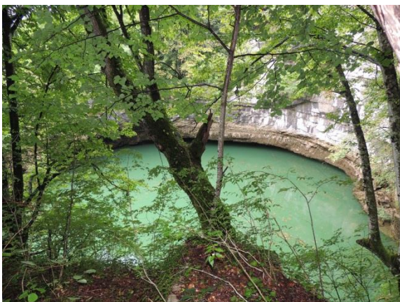
« OKO en crue »