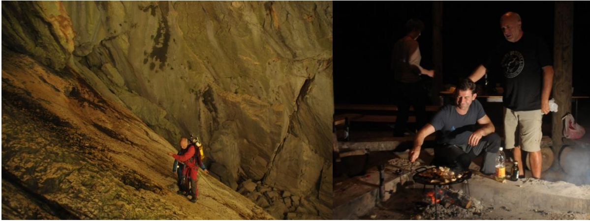
Le portage, les plongées, les grillades, les sauts, la slivo...C'est très dur !