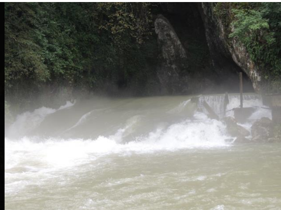
« Expédition résurgence »