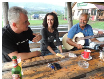
...à la bonne table Bosniaque