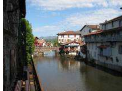
Saint Jean PDP