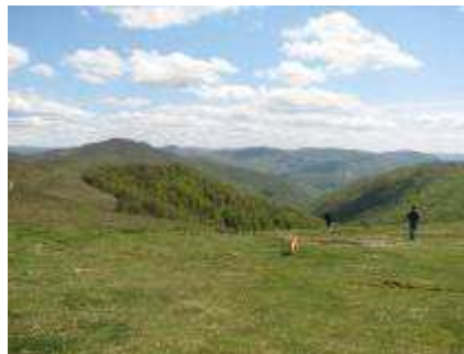
la vue au col