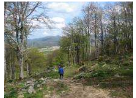
le chemin de tracteur

Montée à la tour d'Urkulu (parking+point de vue), sortir et prendre à droite, puis encore la première à droite et au premier bouquet d'arbres sur la gauche, se garer. Descendre le chemin de tracteur jusqu'à la prairie, prendre à gauche en longeant l'orée du bois par la clairière. Le porche d'entrée se situe là, à env. 200m des véhicules. Pour la petite histoire, la seule personne connaissant l'entrée par temps de brouillard, s'est obstinée à rester sur la route principale, avant de suivre mon hypothèse, nous avez tourné pendant 1h !